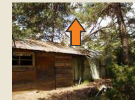
Séparer les arbres