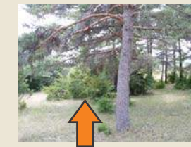
Éliminer les broussailles

Éliminer les rémanents = réduire l'intensité de l'incendie