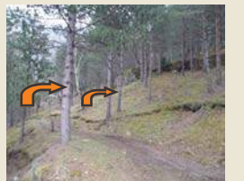
Élaguer les arbres

En aucun cas « débroussailler » ne signifie « couper tous les arbres »